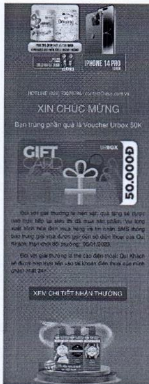
Hình ảnh trúng thưởng Voucher urbox 50.000đ