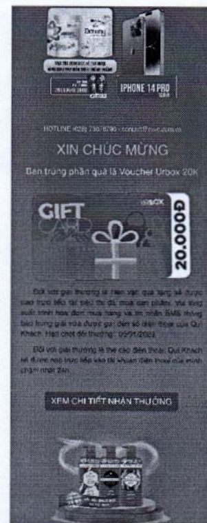
Hình ảnh trúng thưởng Voucher urbox 20.000đ

Đồng thời trả kết quả qua tin nhắn qua số điện thoại của khách hàng cụ thể như sau: