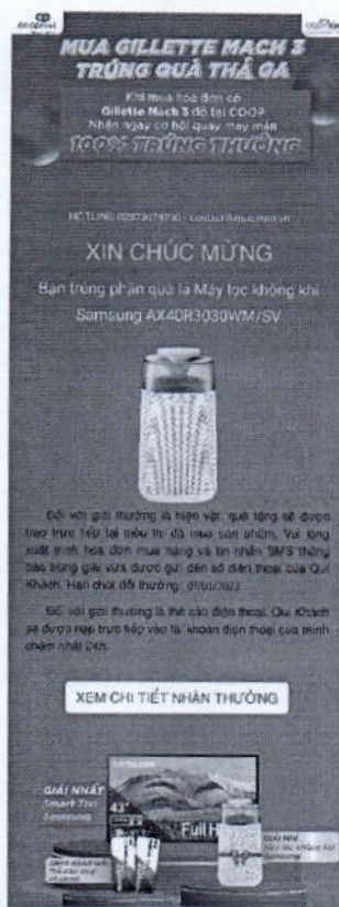
Hình ảnh Trúng thưởng Máy lọc không khí Samsung AX40R3030WM/SV