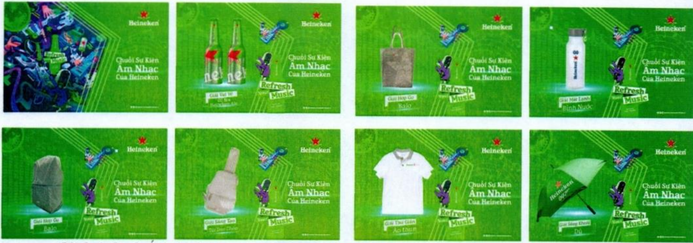
(hình ảnh phiếu rút thăm trúng thưởng 100%)